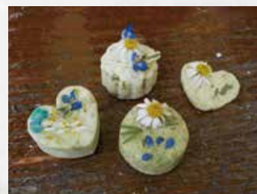
自然パワーで女子力UP★

ハーブは私たちの、心や体にさまざまなプラス効果を与えてくれます。”気が付き”と感性で自然のチカラを日常に取り入れるそんなきっかけ作りをしよう。