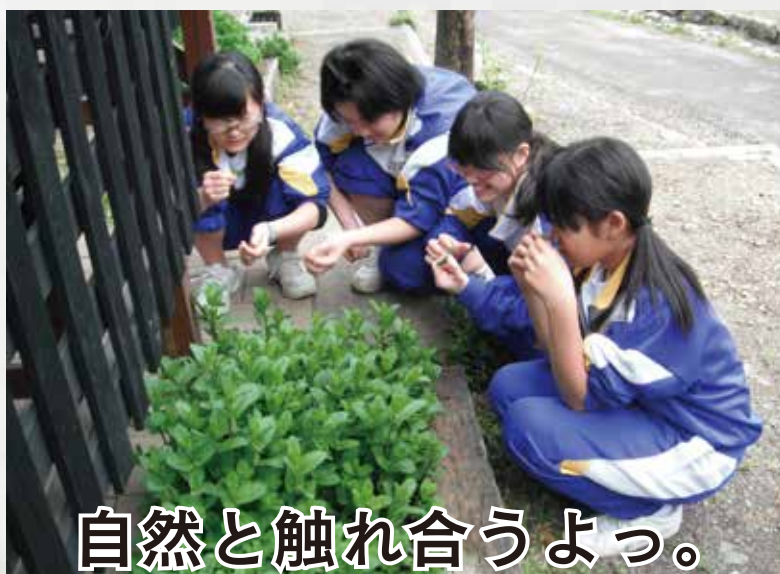
自然と触れ合うよっ。

体験時間 : 6時間 30分 活動場所 : 自然園内 推奨時期 : 4 ~ 10月 開催人数 : 25~40名