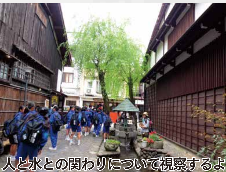
人と水との関わりについて視察するよ