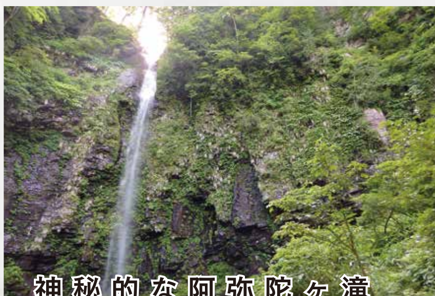
神秘的な阿弥陀ヶ滝

体験時間 : 6 時間 30 分 活動場所 : 郡上市白鳥町 推奨時期 : 4 ~ 10 月 開催人数 : 10 ~ 20 名