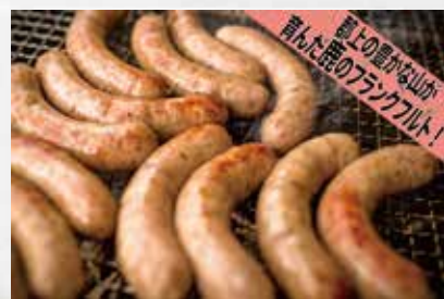
自然の恵みに感謝

郡上の若手猟師が、分かりやすく楽しく紹介します！鹿肉は栄養満点の美味しいジビエ肉。命のありがたみを実感できます！！