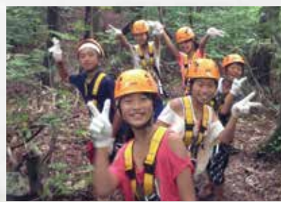
みんなで空に飛び出そう！

1 グループに 1 名のガイドがつきますので、森の解説から道具の取扱いを徹底サポートします。山頂まではリフト or 送迎付きなので、体力が無くても安心して参加できます。