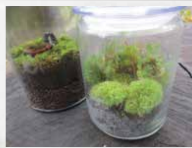
ちょっとおしゃれなインテリアになるよ