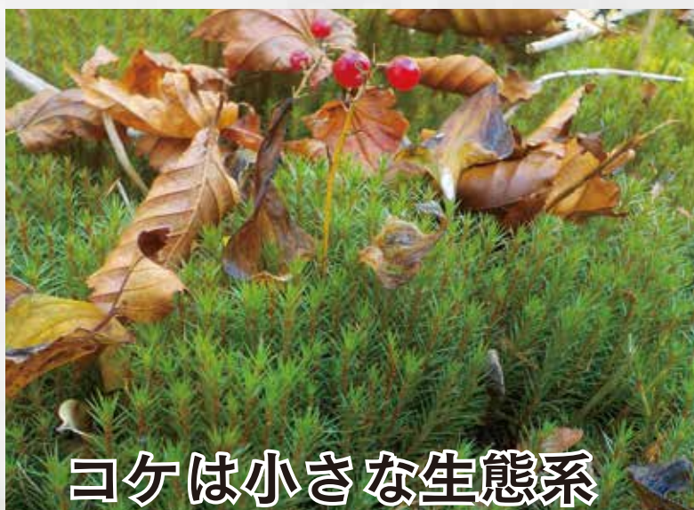
コケは小さな生態系

体験時間 : 6時間30分 活動場所 : 自然園内・裏山 推奨時期 : 4～10月 開催人数 : 20～40名